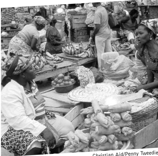
Christian Aid/Penny Tweedie

Am Anfang des einundzwanzigsten Jahrhunderts ist die Welt ein Ort himmelschreiender Ungerechtigkeit und Ungleichheit. Mehr als alles andere sind die Institutionen, Bedingungen, Ordnungen und Praktiken des Welthandels dafür verantwortlich, dass die Armen arm bleiben. Immer mehr Menschen in immer mehr Gemeinschaften in immer mehr Ländern in allen Teilen der Welt können ihre Geschichten darüber erzählen, wie der ungerechte Welthandel ihnen die Existenz genommen und sie und ihre Familien in die Not getrieben hat. (Einige dieser Geschichten finden Sie auf Seite 13.)